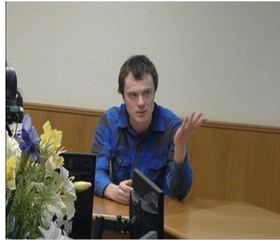
Встречи с представителями профессии