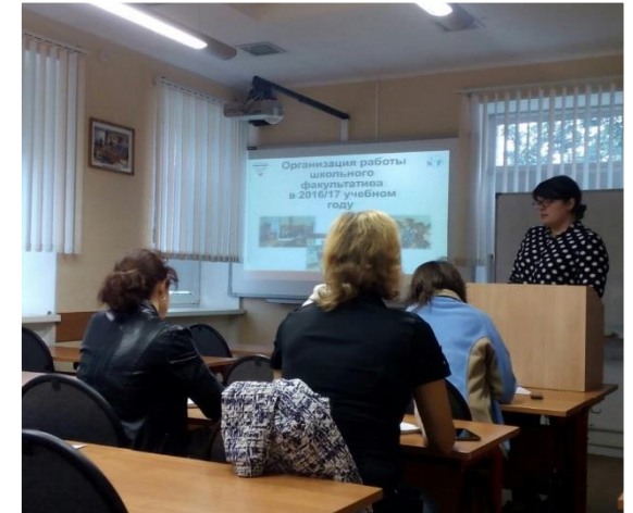
Взаимодействие с родителями