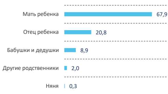
Рис. 2. Среднее распределение объемов родительской и домашней нагрузки между членами семьи во время отпуска по уходу за ребенком, %

В некоторой степени показатели удовлетворенности находят отражение в распределении домашних обязанностей внутри семьи. Большая часть нагрузки по организации быта и воспитанию детей возлагается на мать ребенка. В среднем оценки объемов женской нагрузки более чем в 3 раза превышают объем времени, который тратят мужчины на реализацию аналогичных обязанностей (рис. 2).