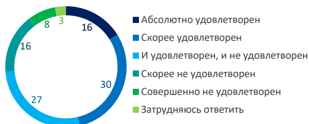
Рис. 1. Уровень удовлетворенности разделением нагрузки в период отпуска по уходу за ребенком, %

В ходе исследования было выявлено, что менее половины родителей удовлетворены текущим распределением нагрузки и обязанностей в период отпуска по уходу за ребенком (рис. 1).