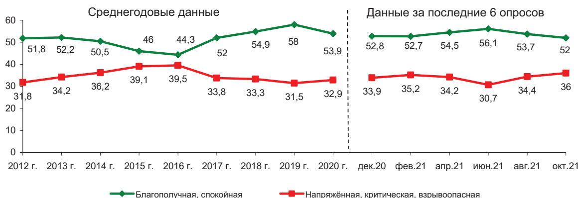
Рис. 11. Оценка населением политической обстановки в области (в % от числа опрошенных)