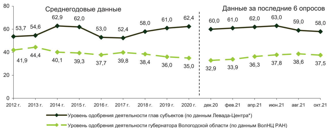
Рис. 9. Уровень одобрения деятельности глав субъектов РФ (в % от числа опрошенных)