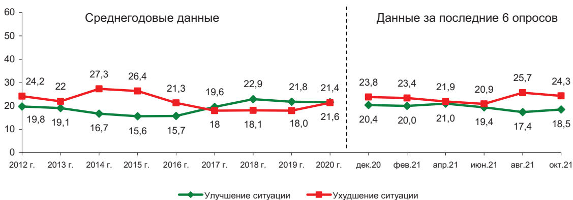
Рис. 12. Что ожидает область в ближайшие месяцы в политической жизни? (в % от числа опрошенных)