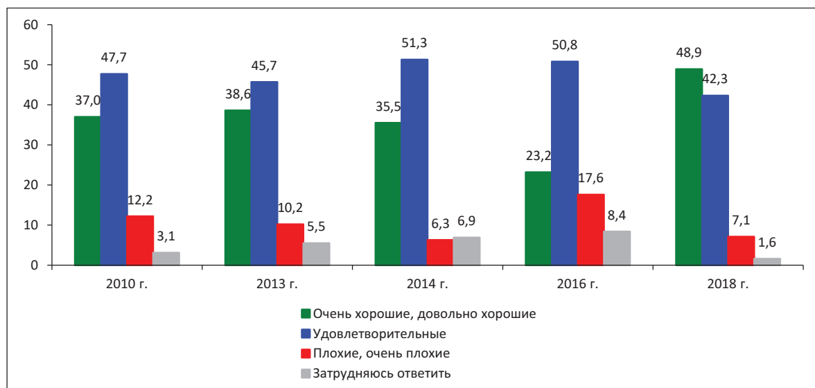
Рисунок 11. Оцените, пожалуйста, Ваши жилищные условия (в % от числа опрошенных)