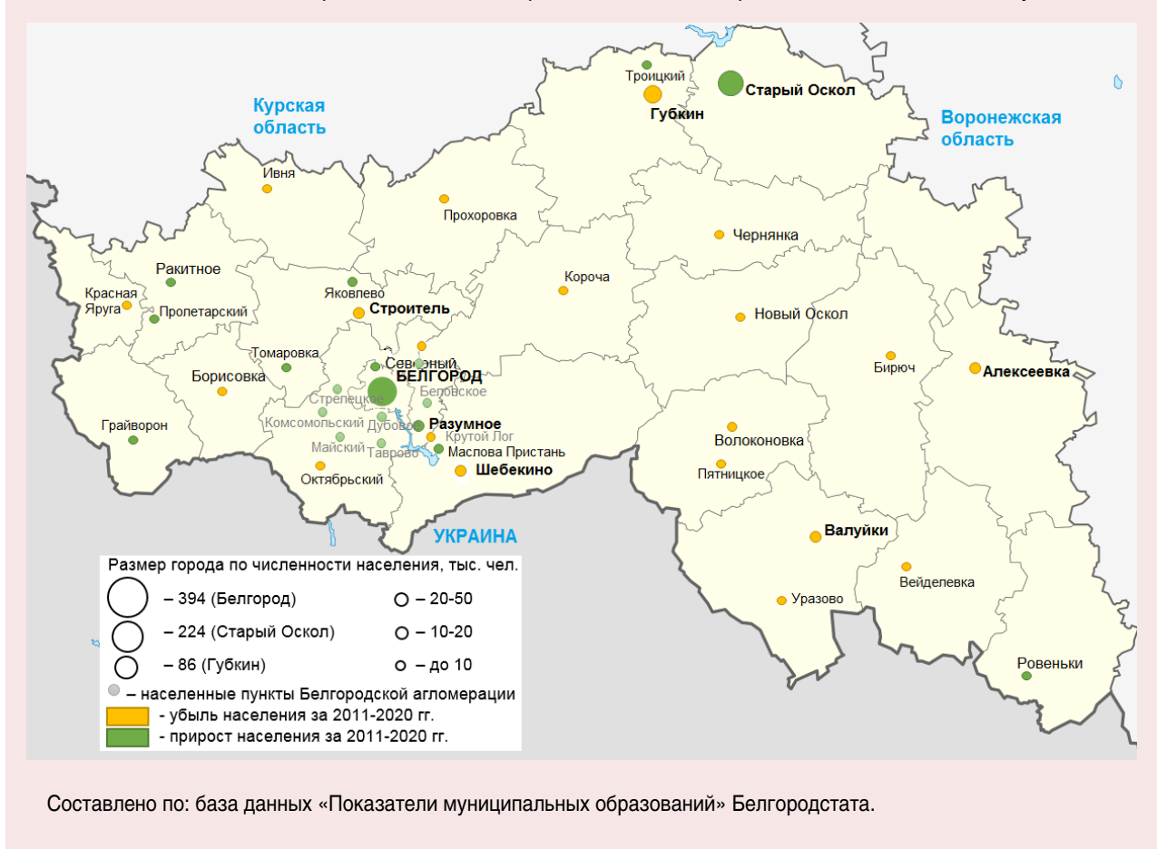
Рис. 3. Система городов и поселков городского типа Белгородской области в 2020 году

Второй город региона – Старый Оскол – значительно (на 19,4% в 2020 году) превышает нормативное значение по правилу «ранг – размер». Далее мы можем обратить внимание, что численность городов несколько ниже того стандарта, который задает Белгород. Если в 2011 году Губкин несколько отставал от третьего места в рейтинге городов, то в 2020 году он уже отстает от четвертого места. Все это свидетельствует о растущей дифференциации городов по численности населения.