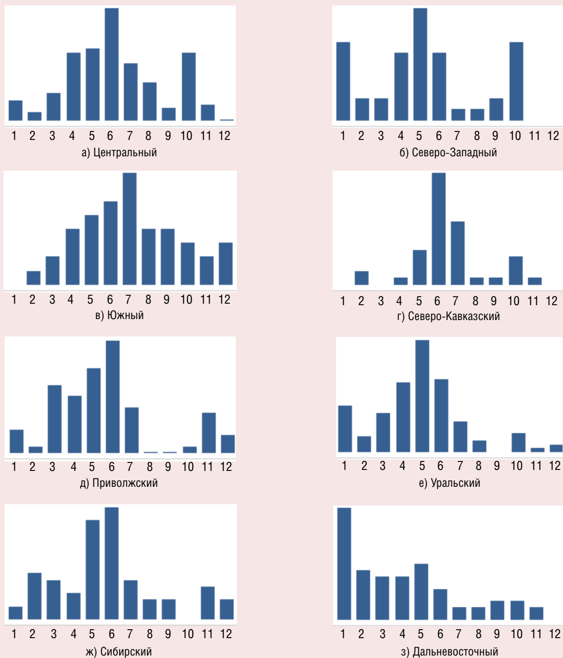
Рис. 1. Распределение городов по численности населения в федеральных округах России, на 1 января 2021 г., ед.

По столбцам: 1 – до 10000 чел., 2 – 10000–14999 чел., 3 – 15000–19999 чел., 4 – 20000–29999 чел., 5 – 30000–49999 чел., 6 – 50000–99999 чел., 7 – 100000–149999 чел., 8 – 150000–199999 чел., 9 – 200000–249999 чел., 10 – 250000–499999 чел., 11 – 500000–999999 чел., 12 – 1000000 чел. и более).