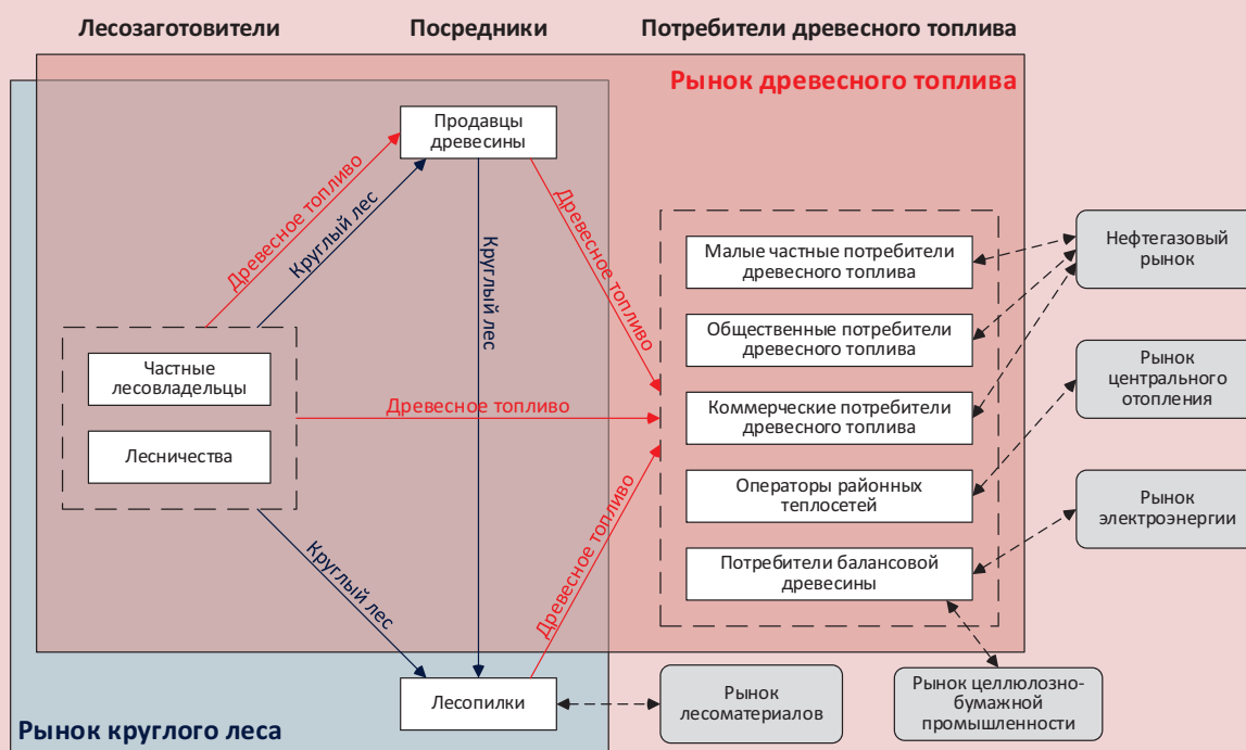
Рис. 1. Схема взаимодействия агентов на рынке и с внешней средой