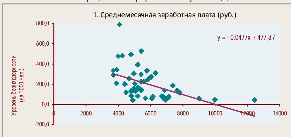
Рисунок 2. Взаимосвязь безнадзорности несовершеннолетних со среднемесячной заработной платой (1), соотношением заработной платы и уровня прожиточного минимума (2), миграционным приростом или убылью (3)

Увеличение среднемесячной зарплаты жителей области способствует снижению уровня безнадзорности несовершеннолетних.