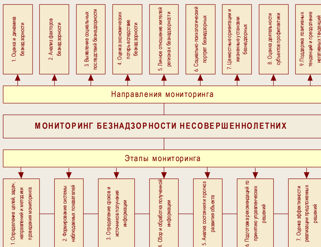
Рисунок 3. Схема организации мониторинга безнадзорности несовершеннолетних

Автором аргументируется предложение о проведении регулярного комплексного мониторинга с целью анализа и оценки современного состояния безнадзорности в детско-подростковой среде и обоснования возможностей по совершенствованию региональной социально-экономической политики в области решения проблем безнадзорности. Организация мониторинга предусматривает определение задач, принципов и основных направлений его проведения, информационной базы, исполнителей, структуры показателей (субъективные и объективные) и единиц их измерения. Схема организации и проведения мониторинга изображена на рисунке 3.